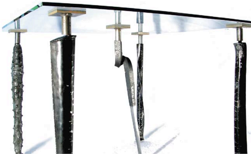
L'Emplume [DMA Métal] : Mobilier (thème : Travailler ; en relation avec la sphère)

INTERNATIONAL EXHIBITION CUMULUS - CUMULUS FRANCE LIEU UNIQUE