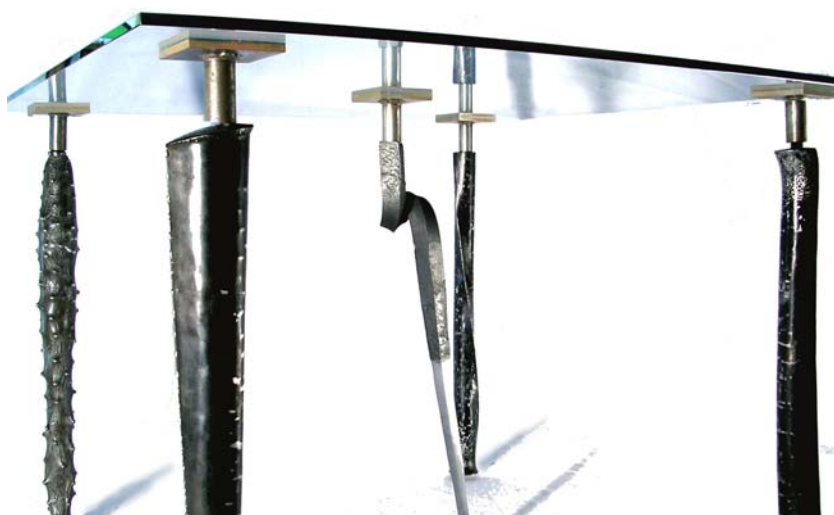
L'Emplume (DMA Métal) : Mobilier (thème : Travailler ; en relation avec la sphère)

65, rue Olivier de Serres F 75015 Paris Tél. : 33 (0) 1 53 68 16 90 Fax : 33 (0) 1 53 68 16 99 www.ensaama.net