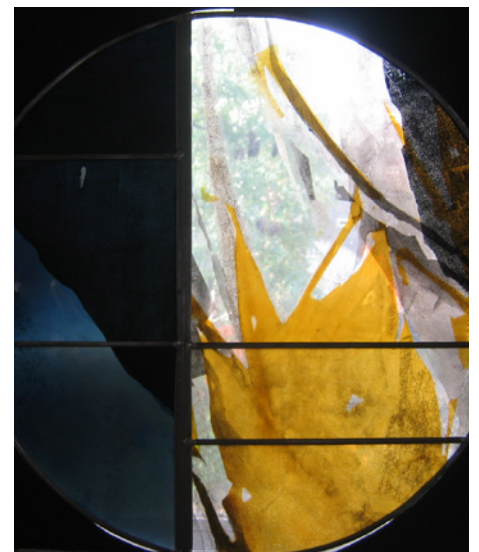
Aurélië RÈGUE (DMA Vitrail) : Eleusis (thème : Se nourrir)