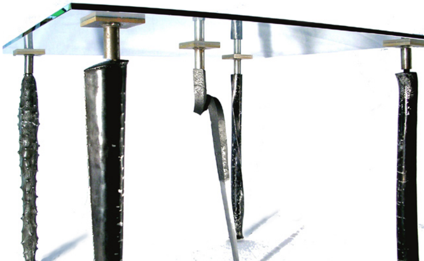
L'Emplume (DMA Métal) : Mobilier (thème : Travailler ; en relation avec la sphère)

As a member of Cumulus, an international network of art, design and media schools, ENSAAMA Olivier de Serres takes part in a wide international design exhibition at the lieu unique in Nantes from June to September 2006. The exhibition shows students' and graduates' projects from more than fifty schools in Europe. As a member of Cumulus France, Olivier de Serres takes part in the organization of the exhibition.