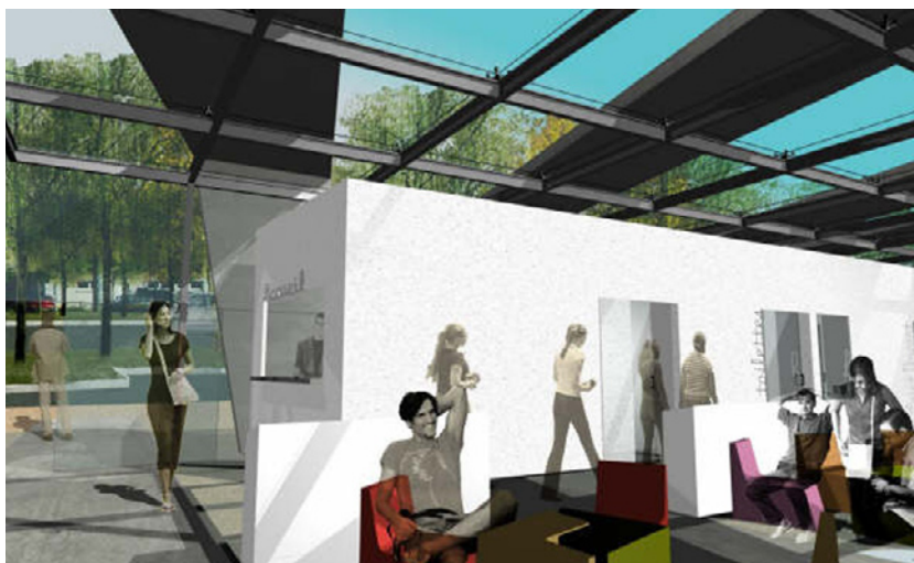
Rémy BARDIN (Axe Espace) : Un parlour en maison d'arrêt (thème : Communiquer).

L'ENSAAMA-Olivier de Serres, membre de Cumulus (réseau des écoles supérieures d'arts d'art, de design et de médias) participe à la plus grande exposition internationale de la jeune création en design organisée au Lieu Unique à Nantes, du mois de juin au mois de septembre 2006.